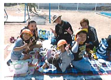
芋煮会おいしかったよ