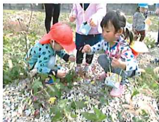
探検バッグを持って秋発見！