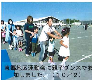
東郷地区運動会に親子ダンスで参加しました。(10/2)