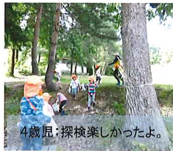
4歳児:探検楽しかったよ。