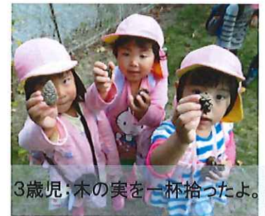
3歳児:木の実を一杯拾ったよ。