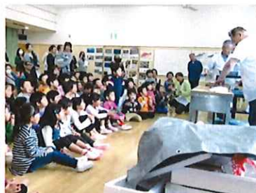
いろいろなお魚すごいね