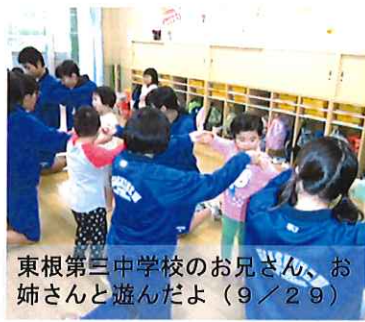
東根第三中学校のお兄さん、お姉さんと遊んだよ(9/29)