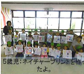
5歳児:ネイチャープリントを作ったよ。