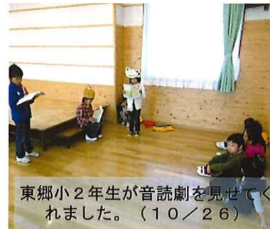
東郷小2年生が音読劇を見せられました。(10/26)