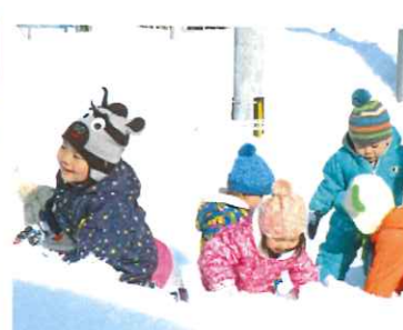
未満児：よいしょ！お山を登るぞ