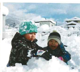
3歳児：雪のお山できたよ