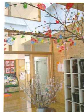
啓翁桜とだんご木