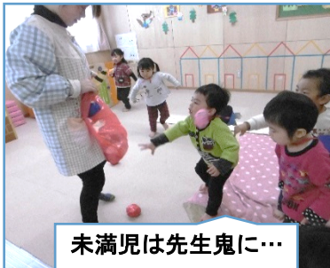
未満児は先生鬼に… 「鬼は～ そと」