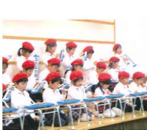
年長組 ピアノ演奏