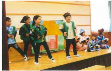
年中組 音楽劇「おむすびころりん」