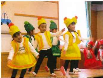
年少組 お遊戯「どんな色が好き」

12月8日(金)に生活発表会が行われました。今年生活発表会は、子ども達の「やってみたい」「楽しい」がいっぱい詰まったプログラムになりました。変身遊びやお絵かきが大好きな3歳児ちゅうりっぷ組は、「くれよんのくろちゃん」の絵本より「くれよん」に変身してお遊戯を、4歳児たんぽぽ組はごっこ遊びから劇遊びへ発展した音楽劇と、合奏に取り組みました。5歳児さくら組は、自分たちで役割を決めたり、お友達の良さを認め合いながらみんなで力を合わせた「さるかに」の言語劇と、鍵盤ハーモニカの演奏を発表しました。保護者の皆様、来賓の皆様の温かいまなざしに見守られながら、子ども達は一人ひとり伸び伸びと生き活きと発表できました。これが子ども達の自信に繋がっていく事でしょう。たくさんの拍手をありがとうございました。