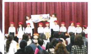
年長組 絵本暗唱 「きよだいなきよだいな」