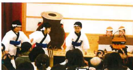
年長組 言語劇 「さるかに」