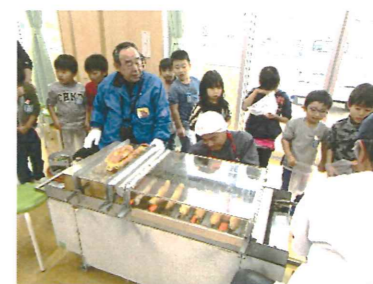
○焼き麩体験(5歳児)11/21 出来立ての麩を味わいました。