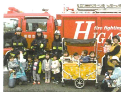
消防車の前でハイ・チーズ。