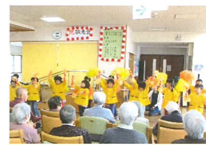
○白水荘慰問(5歳児)11/5 踊りと歌をプレゼントしたよ。