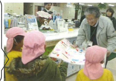
○地域の人にありがとう。11/22