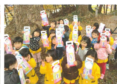
オリジナルの千歳あめ袋で～す。11/15