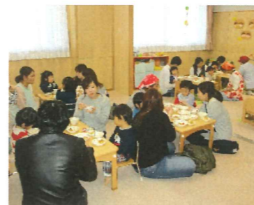
お家の人と一緒に美味しいね。