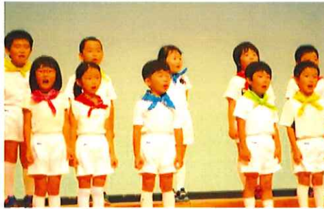
歌声がホールに響きました。 さすが年長さん!口の開け方が違いますね。