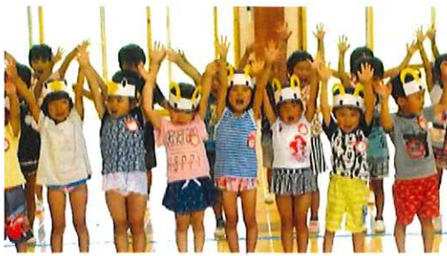
練習の時から張り切って歌って いましたよ!