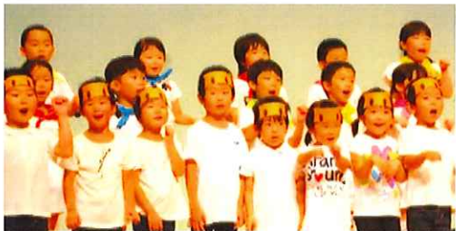
サハトベに花の舞台上で歌を披露しました