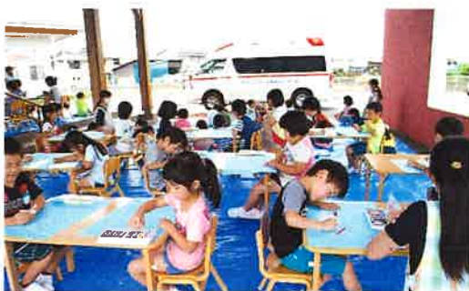
消防車を見ながら描いたよ!(年長児)