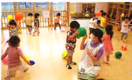
(2歳児) 保育室やお遊戯室でもたくさん遊んでいます