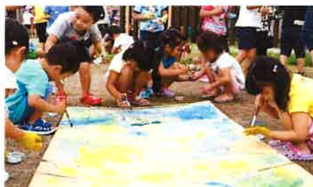
絵の具遊び、楽しいね!(年中児)