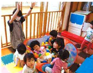
カラフルボールで遊んだよ!(1歳児)

敬愛信のホームページから園だよりを見ることができます。またブログで行事の様子などをお知らせしておりますので、ぜひご覧ください。「かほくあいこども園」で検索するとすぐにご覧になれます)