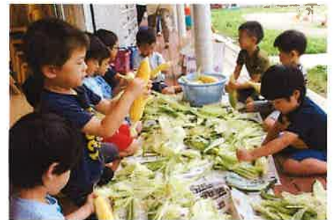
給食やおやつに出されるトウモロコシの皮むき (年中)

給食はみんなで楽しく食べるということが大きな目標になります。無理強いするわけではありませんが、様々な食材に慣れ親しんで好き嫌いなく食べるようにしていきたいと考えています。多分家では嫌いなものは口にしない子どもさん多いと思いますが、こども園ではどんな給食でもほとんど残さず完食しています。たくさんの友達や先生がいる中で食べることの意義は大きいなと感じています。少しずつでも大人の味を楽しめるようになって欲しいと思っています。