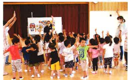
かもしかクラブで交通ルールを覚えます(年少児)