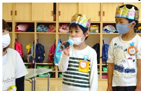
5月の誕生会の様子。年次ごとに行っています。