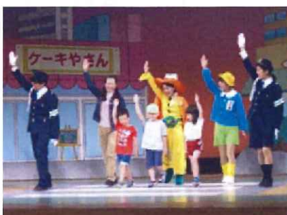
「JA 交通安全ミュージカル」に4・5歳児が行ってきました。