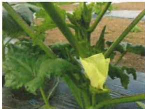
オクラの形ときれいな花にビックリ。