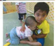
ボクが面倒みてあげるよ。