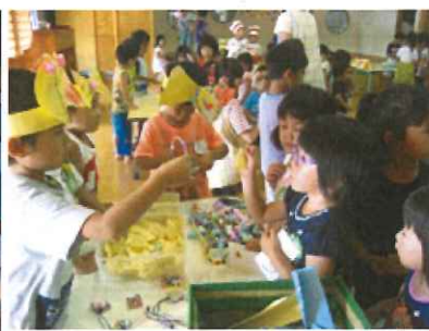
小さい子達も喜んで参加。「かっぱ祭り縁日ごっこ」は大盛況。