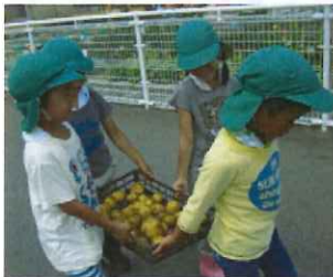
「きたあかり」が大豊作。第3回親子畑ツアーでは、ジャガイモ掘りを体験していただきました。