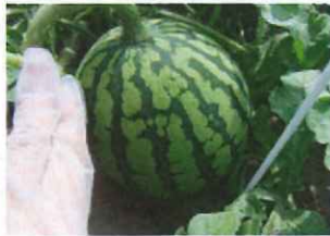
大きくなったスイカ。畑にいっぱい生っています。