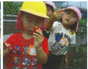
枝豆の周りの草取りをがんばるわくわく組さん達。「このトマト、丸くて長いよー。」(もりもり組さん)