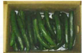
毎日水かけのお陰でキュウリがたくさんできました。給食で、冷たいキュウリスープや漬物にして、さっそく「いただきます。」