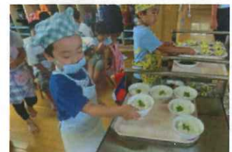
スナップエンドウを大きくして豆を取って作る豆ごはんをリクエストしました。お知らせを作ってお願いをし、ぴよんぴよん組に大きく育った豆を見せに行きました。色も鮮やかで柔らかくおいしい豆ごはんを給食に出していただきました。