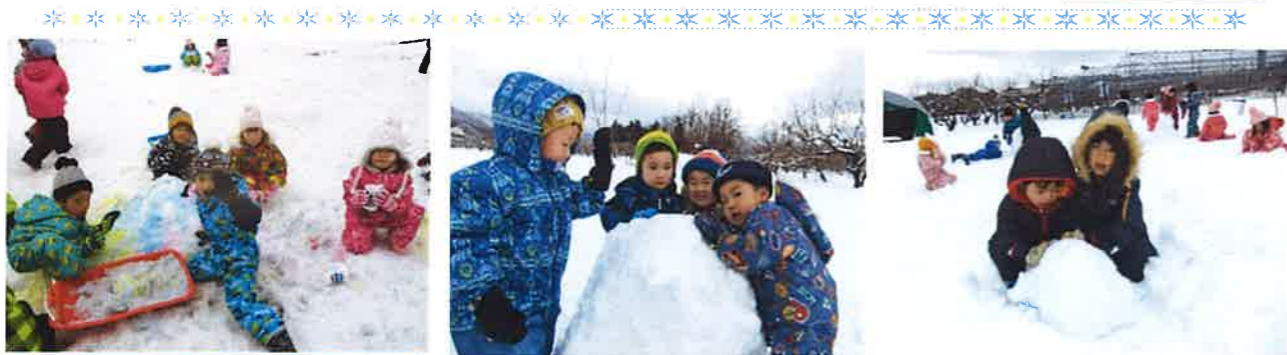
「レインボーカラーの雪山だよ！」