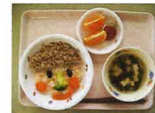
「福笑いごはん」の給食 自分で好きなお顔を作りました。

各クラス懇談会の時間 17:00~18:00 ご出席よろしくお願ひします。 *3・4歳児クラスは、終了後に 15分間の歯科講話があります。