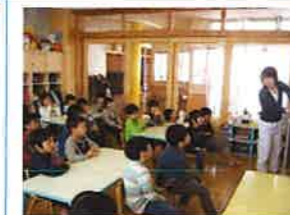
5歳児 栄養指導と選択給食 楽しい思い出 またひとつ

主食・主菜・副菜・汁物と、それぞれ好きなものを選んで自分で盛り付けました。栄養指導では、食事のバランスやハイキングのマナーについても学びました。