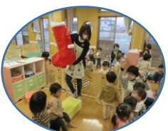
サンタさんから届いたよ!