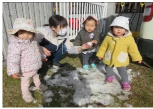
びよびよ組「初めての雪、冷た〜い!」