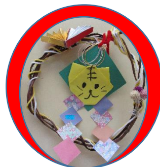
きらきら組作 寅年しめかざり

本年も、職員一同「敬愛信」の心を大切に、子ども達の瞳輝く毎日を積み重ねてまいります。 保護者の皆様、地域の皆様、どうぞよろしくお願いたします。