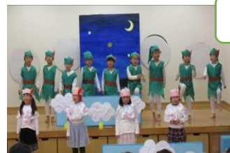
きらきら組「ネバーランドと魔法の羽」