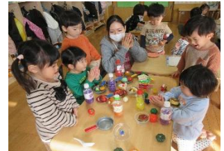
にこにこ組「お店屋さんで〜す」