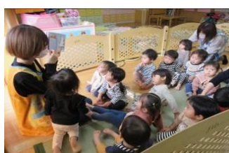
びよんびよ組「お昼寝前の絵本大好き」