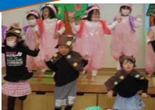
もりもり組「お家をつくろう!」 わくわく組「わくわく組の音楽め競争」