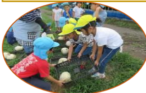
ー楽しかったね 暑い夏の思い出ー