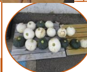
夏野菜 大収穫だよ