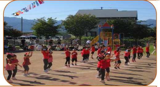
10.1親子運動会-応援ありがとうございました-

冬の足音が聞こえてくる11月。小さい組の懇談会では、お家の方とお子さんの成長を共に喜びあい、大きい組では、12月の生活発表会に向け、子ども達の思いや表現を大切に育みます。深まる秋を元気にすごしていきましょう。