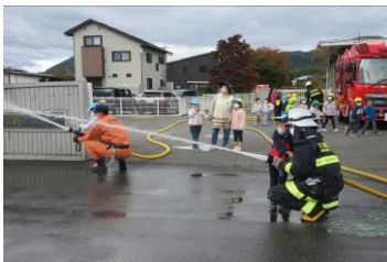
【総合避難訓練〈火災〉】