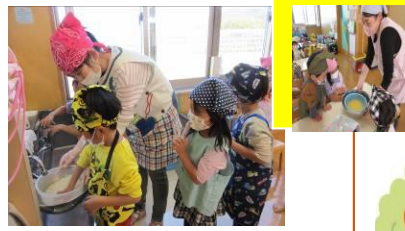
【わくわく・きらきらクッキング】