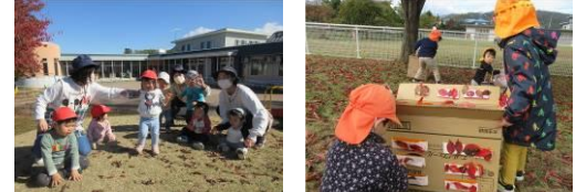
園庭・原っぱ、散歩道、みんなで秋と仲良し