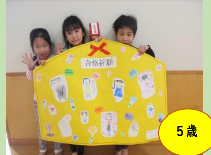
宮川・南中三年生への「特大合格お守り」