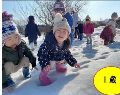
お友だちの雪の足跡い～っぱい