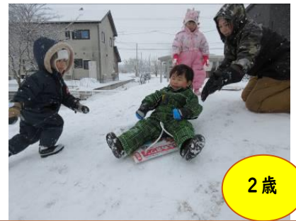
築山からたくましく「初そり滑り」