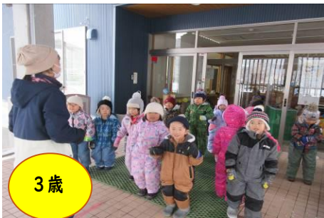
「雪ダルマの歌♪」歌いながら準備体操