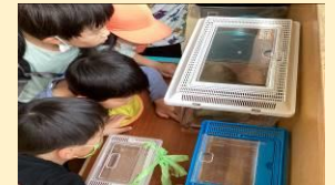
「4歳児のおたまじゃくし、 小さな手足がはえてきたよ!」