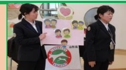
命を守る「かもしかクラブ」