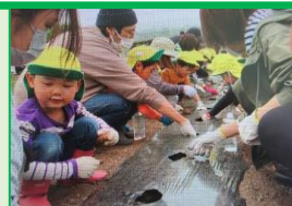
きらきら組「保育参加」