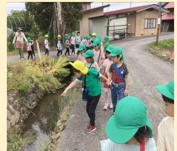
5歳児きらきら組「ザリガニいるかな？」 「ザリガニをとって育てる」大作戦中