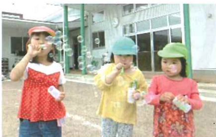
シャボン玉 飛ばそう！