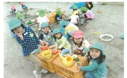
美味しいお茶ができたよ