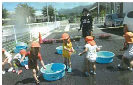
プール開きの日は、天気も良く、1, 2歳児の子ども達も水遊びを楽しみました。