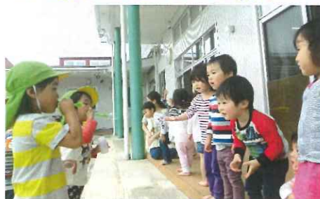
小さい組さん、見て。見て。