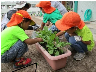
はつか大根が大きくなったよ。 美味しそうだね(3歳児)