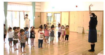
3歳児：初めてのかもしかクラブ

これまで延期になっていたかもしかクラブを行いました。道路を渡る時はストップして右左を確認すること、おうちの人と手をつなぐことを指導員の方に教えてもらいました。おうちの方も登降園時は、 お子さんから手と目を離さないようにお願いします。