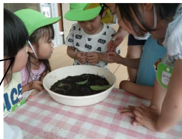
ダンゴムシを捕まえたよ 何を食べるのかな(4歳児)