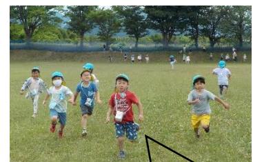
三中のグラウンドに園外保育。 楽しい～。(5歳児)