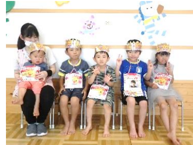
6月生まれのお友達