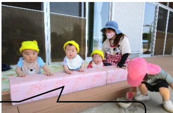
テラスで日向ぼっこ。 いい気持ち～。(0歳児)

7月は、夏ならではの遊びを体験するいい季節です。3～5歳児のプール遊びは、新型コロナウイルス感染予防の為残念ながら中止を余儀なくされましたが、活動のねらいを変えて充実したものになるように計画しているところです。3歳未満児・3歳以上児の夏の遊びのねらいは次の通りです。0歳児は沐浴をしてもらい気持ちよく過ごします。1、2歳児は、水遊びを通して水の感触を楽しみ気持ちよさを感じる。3～5歳児は、①様々な水遊びを体験する中で水の気持ちよさを感じたり、水の性質に気づいたりしながら友達と夏の遊びを楽しむ。②泥遊びで様々な感触を味わうなど五感を使った遊びを存分に楽しむ。となっています。熱中症や未だ収束しない新型コロナウイルス等に気を付けながら、こどもたちの「楽しい」が一杯になる保育をしていきます。