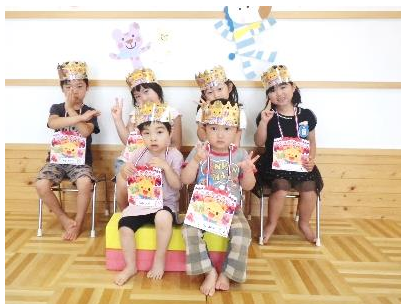
4月生まれのお友達