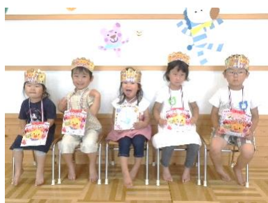
5月生まれのお友達