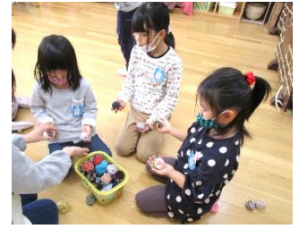
以上児：お手玉遊び・かるた