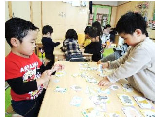
2歳児：絵カード遊び