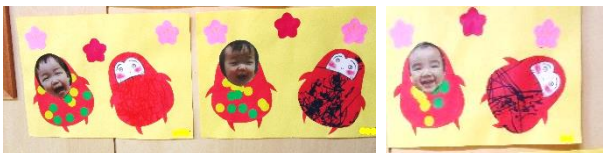
0歳児：だるまさんだよ！