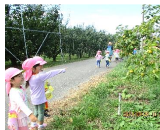
畑の果物たくさん見つけたよ: 3歳児

5歳児は、園の畑で育てたさつまいもを持って、朝日少年自然の家に「焼き芋遠足」に行ってきました。森の中でたくさん遊んで、美味しい焼き芋を食べ、遠足を楽しんできました。