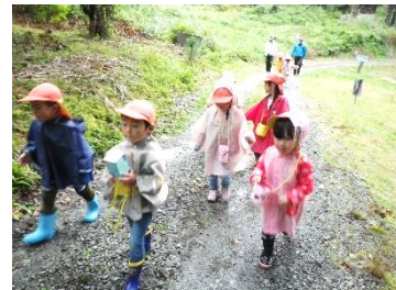
忍者遠足・カッパの術: 4歳児