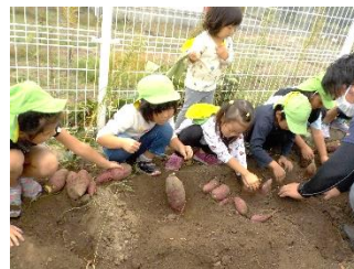
出てきた。出てきた たくさんのさつまいも