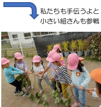
私たちが手伝うよと 小さい組さんも参戦