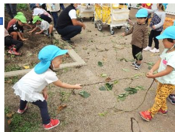
こちらではすみれ組が 綱引き遊び