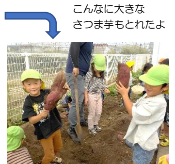
こんなに大きな さつまいもとれたよ