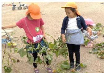
私たちはお姫様よ