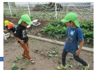
つるのベルトでヒーローに変身