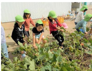
みんなでつるを引っ張るぞ