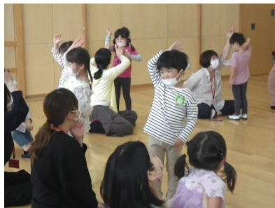
ジェスチャーゲーム(4歳児)