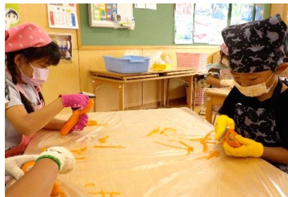
人参の皮むき。みんな上手です。5歳児