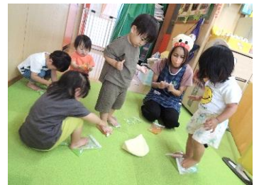
足で踏んでみたよ。面白い！