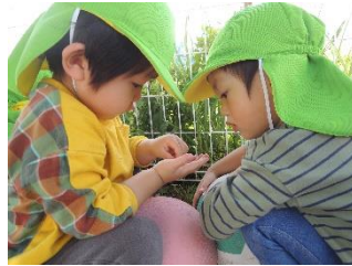
見せて！ いいよ。だんご虫だよ