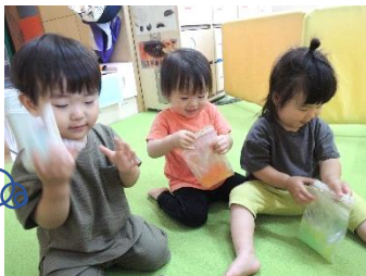
ぶにゅぶにゅしてる〜 これなんだ？