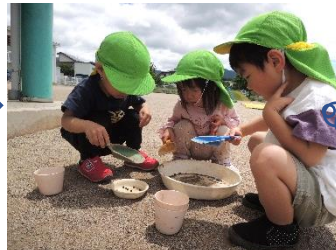
だんご虫にご飯あげよう！