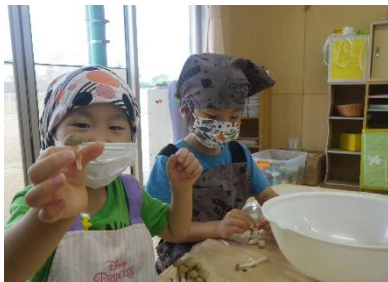
しめじをほぐしたよ。キノコの臭いって はじめて嗅いだよ：4歳児