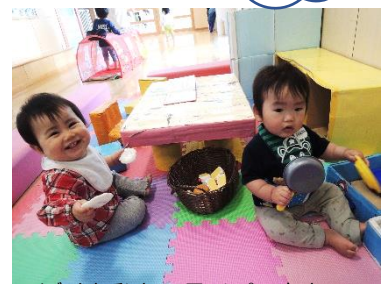
ほくも私もフライパンをもって お料理のお手伝い？（0歳児）