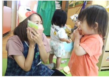
ほっぺについたら…冷たいね 気持ちいい