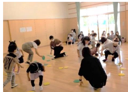
めくってめくってよーいドン(5歳児)