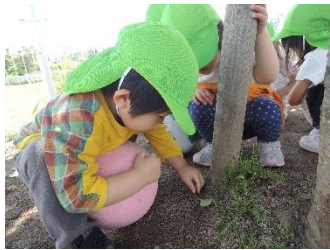
だんご虫いないかな？ あっ見つけた。