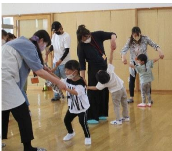
ふれあいあそび(3歳児)