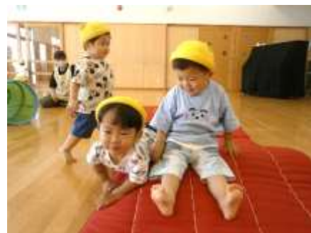
マットのお山を登って滑るよ：1歳児