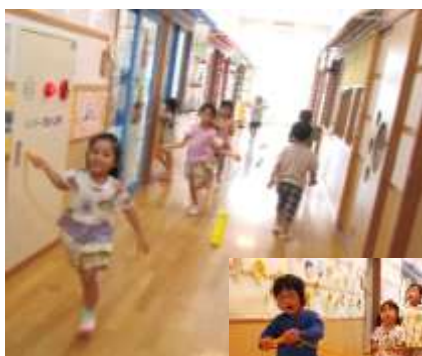
長い廊下で、駆け足縄跳びや電車ごっこ ：3・4・5歳児