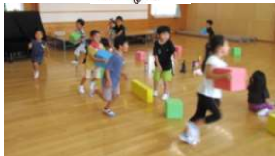
お遊戯室でマラソン。僕5週目、私は7週目！ ：3・4・5歳児