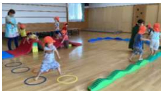
飛んだり、渡ったり…サーキット遊び：2歳児

今年の運動会は酷暑のため10月に変更いたしました。思い切り体を使った遊び経験をした子ども達は、これからの運動会や運動会ごっこ（0・1・2歳児）に元気いっぱいに取り組むことでしょう。