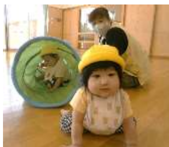
ハイハイでこんにちは：0歳児