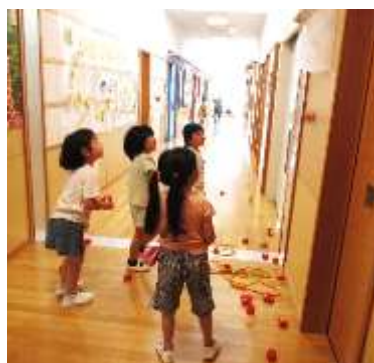
まり入れコーナーでまりを入れるぞ！：3・4・5歳児