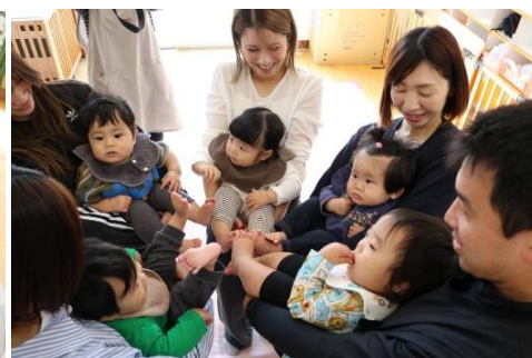
0歳児も親子で笑顔いっぱい！